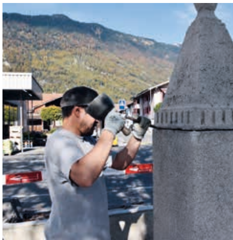
Der Steinmetz an der Arbeit.